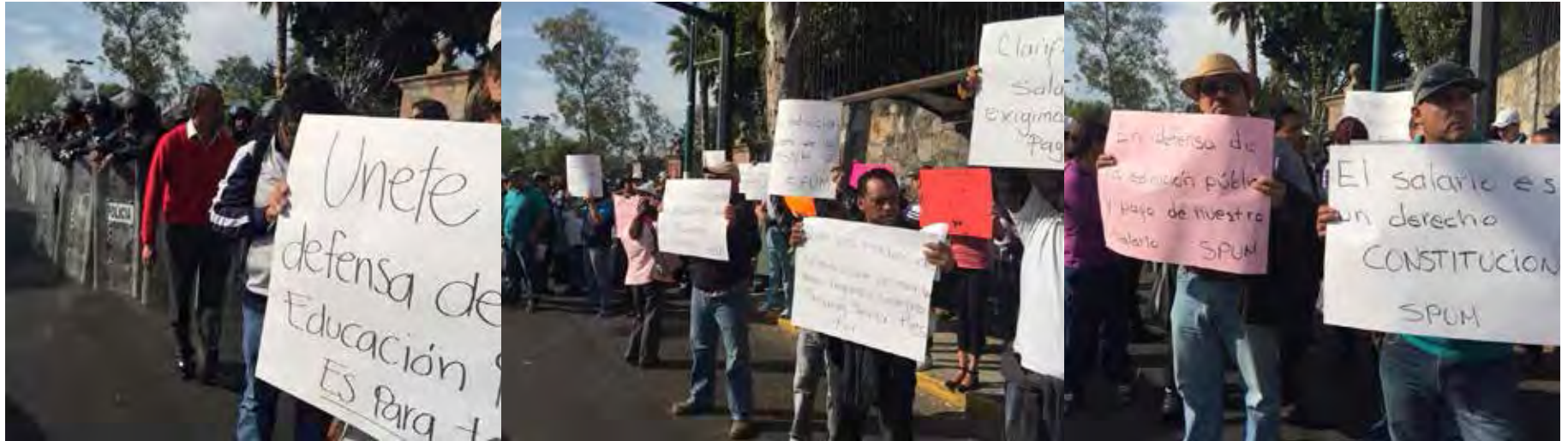
Plantón en Casa de Gobierno