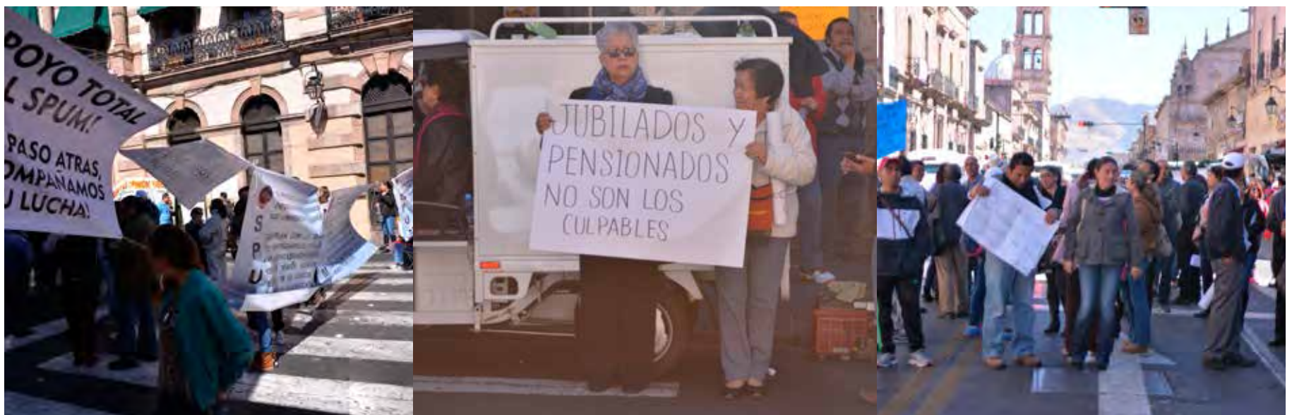
Protesta en el Congreso del Estado