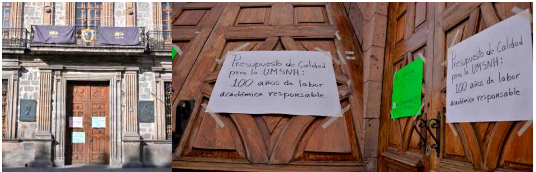
Paro por 12 horas y cierre de instalaciones