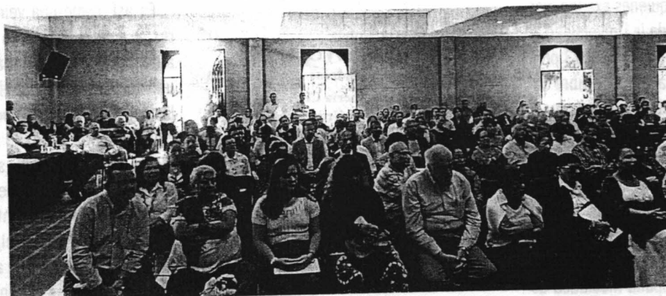
Excelente asistencia al Foro