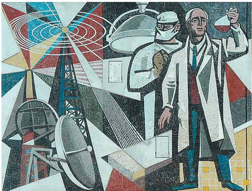
Mural de la Casa del Profesor, en Berlín Alemania.

La solución debe ser más educación de calidad y para ello, en lugar de reducciones necesitamos que se incremente el presupuesto federal de las universidades públicas, porque la matrícula sigue aumentando, y si queremos una mejor sociedad debemos apostarle todo a la educación.