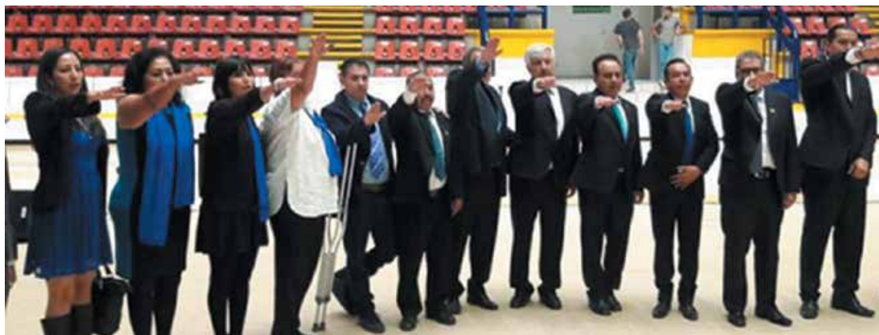
Foto del 12 de noviembre del 2018, en la Toma de Protesta de la Planilla Azul que resultó ganadora en las elecciones del Sindicato de Profesores de la Universidad Michoacana (SPUM), en el salón de usos múltiples de la Universidad Michoacana, y que actualmente son miembros del Comité Ejecutivo General durante el periodo 2018-2021.