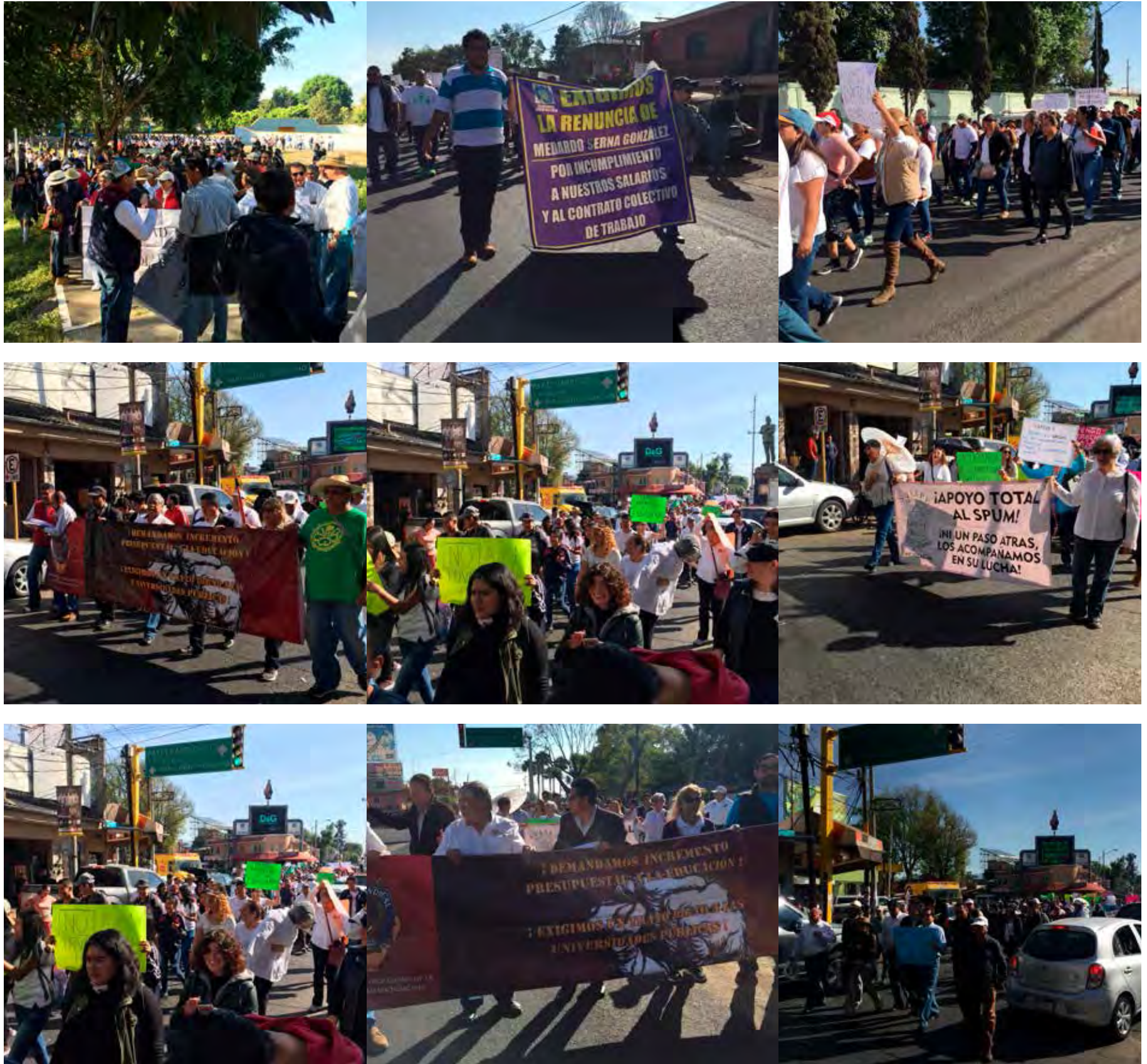
Mobilización en Uruapan.

Uruapan, de muchas maneras, fue uno de los principales soportes para la fundación del SPUM. Hoy, camino a los 42 años del Sindicato de Profesores de la Universidad Michoacana, en Uruapan se convocó a una Marcha-mitín para exigir las prestaciones no pagadas por las autoridades universitarias. El año anterior, la actual administración solicitó una y otra vez, adelantos de presupuesto, con lo que pagó asuntos que nadie sabe, pues hay una absoluta ausencia de transparencia. Pero este año, al parecer no lo ha solicitado, pues hay una provocación y fin de por medio, colapsar la Universidad, a fin de justificar un ataque más no solo al sindicalismo, sino también a la educación pública universitaria. Este 17 de enero en Uruapan se demostró que esta protesta no terminará sin cuentas claras y una educación libre de amenazas y trucos presupuestales.