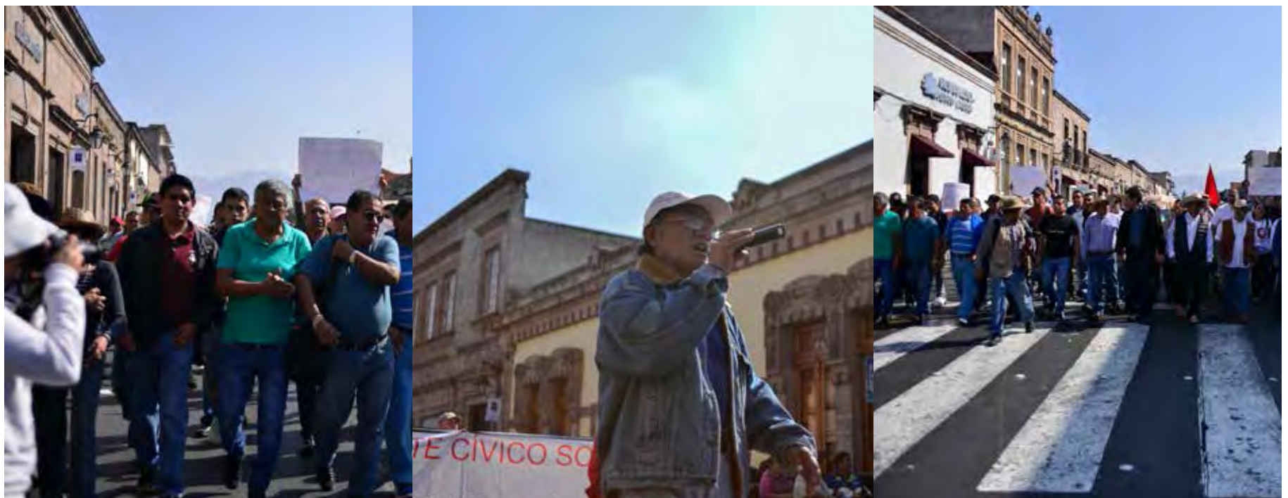
Movilización en Morelia.

El pasado 11 de enero, sindicatos del sector educativo, incluidos el SUEUM y el SPUM expresaron su inconformidad, saliendo nuevamente a las calles de Morelia, en virtud de retenciones de pagos y de diversas prestaciones, incluido el aguinaldo. No es casual, de manera alguna, que los gobiernos federal y estatal sub-administren el presupuesto de educación. Pues con ello, bien lo saben, provocan la protesta y también el descontento de la ciudadanía, incentivado este por periodistas sin ética, a los que llamamos con desprecio “opinadores a modo”, pues carecen de objetividad y emprenden su cruzada en favor de la inseguridad social para los trabajadores. Dicen esos “tres peleques” que se tienen excesivas prestaciones, que se deben concluir los contratos con los sindicatos, pero nada comentan de los malgastos de gobierno, ni de los hurtos que permiten que funcionarios paguen fianzas millonarias y tampoco de las increíbles auditorías forenses que a nada llegan. Así las cosas, los trabajadores de la educación seguiremos protestando en las calles y plazas.